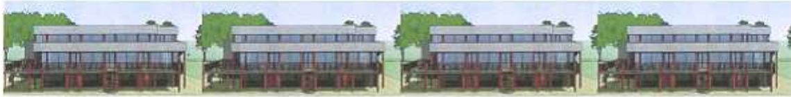
Het AMVJ Sportcentrum